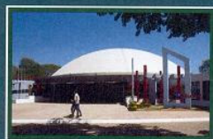
Centro de Convenciones Campus, San Lorenzo - Paraguay